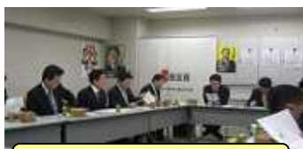
民主党青年局定例役員会

青年局 衆参若手議員を 中心に勉強会の企 画、インタビューの受 入れや街頭活動に ついて話し合っ た。