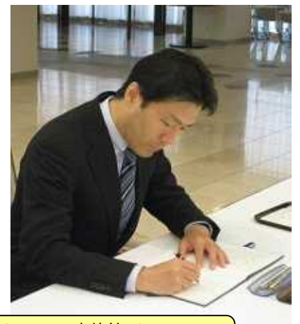
ミャンマー大使館でミャンマー・ サイクロン災害の記帳を行う

特命全権大使 フランシス閣下 と会談。被害 者が100万 人を超える大 惨事に哀悼の 意を表し、被 災者の方々が 早く平常な生 活に戻るよう う心から祈念 する思いを伝 えました。